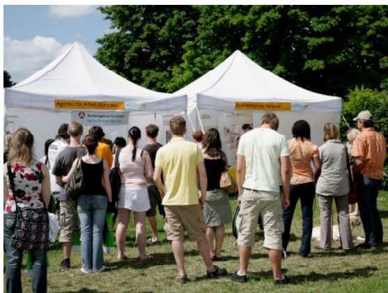
Die Jugendlichen informieren sich an den Unternehmensständen

Der Berufsorientierungstag START Smart 08 war für uns von besonderer Bedeutung, da es die bisher größte Veranstaltung dieser Art für uns war. 22 Unternehmen aus den unterschiedlichsten Bereichen waren bei START Smart 08 am 31. Mai vertreten und haben die Jugendlichen über Berufs- und Ausbildungsmöglichkeiten informiert. Die positiven Rückmeldungen der Jugendlichen und der Unternehmensvertreter haben uns sehr gefreut.