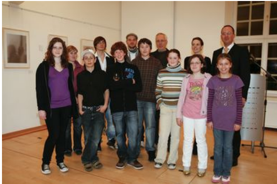
Die Künstler bei der Vernissage

Der bekannte deutsche Fotograf Hubertus Hamm hat in einem Workshop zwölf Jugendlichen einen Einblick in die Kunst der Fotografie ermöglicht. Die entstandenen Werke wurden im März unter dem Titel: „Und meine Welt für Dich“ in den prachtvollen Räumen der Swiss Life in München ausgestellt. Der Erlös der verkauften Bilder kommt der Berufsberatungsstelle START Smart zugute.