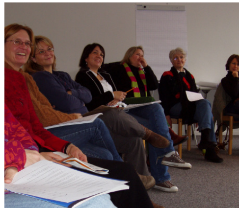
Die Teilnehmer am ersten Seminarwochenende

Seit November 2008 bietet die Nicolaidis Stiftung nun Seminare für Selbsthilfegruppenleiter im Trauerbereich an. Dieses Angebot soll den Aufbau neuer Selbsthilfegruppen unterstützen. Die ersten beiden Seminarwochenenden waren ein großer Erfolg. Alle Informationen zu den Seminaren und zur Anmeldung sind auf der Homepage www.nicolaidis-stiftung.de zu finden.