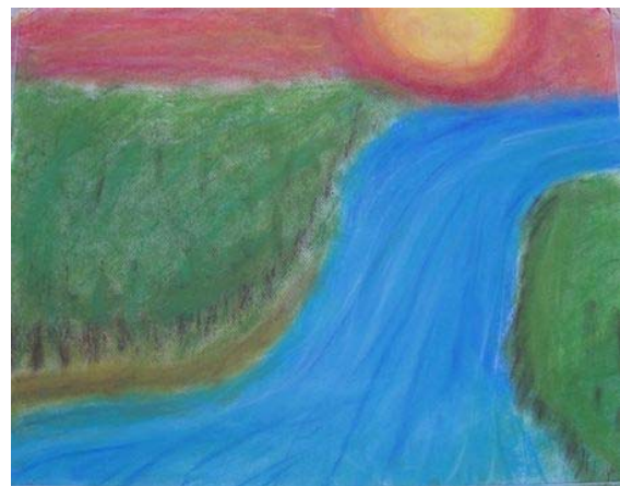
Kinderbild entstanden bei einem Malworkshop

Im Auftrag des Bayerischen Staatsministeriums für Arbeit und Sozialordnung, Familie und Frauen hat die Nicolaidis Stiftung einen Erfahrungsbericht über die Betreuung der deutschen Tsunami-Betroffenen verfasst. Der Bericht stellt einen Überblick über die deutschen Hilfsmaßnahmen und Betreuungsangebote nach der Tsunami-Katastrophe am 26.12.2004 in Südostasien dar, wobei sowohl der Einsatz vor Ort als auch die Langzeitbetreuung der Opfer in Deutschland beschrieben wird. Zahlreiche Organisationen, die an den verschiedenen Hilfsmaßnahmen mitgewirkt haben, wurden für diesen Bericht befragt. Die Nicolaidis Stiftung ist seit dem Jahr 2006 für die langfristige Betreuung und Begleitung der bayerischen Tsunami-Betroffenen zuständig. Der Bericht kann auf der Homepage der Nicolaidis Stiftung heruntergeladen werden.