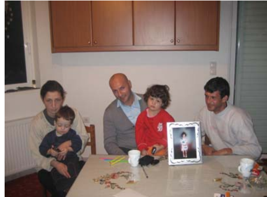
Überreichung der Spendensumme an die betroffene Familie im Dezember 2007