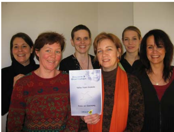
Das Team der Nicolaidis Stiftung freut sich über die Auszeichnung vom Bayerischen Rundfunk

Im Dezember 2007 hat die Nicolaidis Stiftung für ihre Arbeit im Kinder- und Jugendbereich das Bayern3-Sternchen verliehen bekommen.