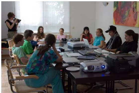
Die Geschichtenerzähler bei der Arbeit

Bei den Projekten im Kinder- und Jugendbereich im Jahr 2007 war das Digitale Geschichtenerzählen ein ganz besonderes Highlight. An den ersten beiden Juli-Wochenenden haben neun Kinder und Jugendliche zusammen mit einer Kreativpädagogin und einer Fotografin eigene Geschichten entworfen und diese mit Hilfe von Fotos und Tonaufnahmen digital erzählt.