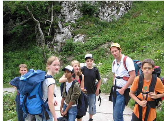
erschöpfte Gesichter bei der Wanderung

Im September 2007 haben acht Kinder und Jugendliche an einem Hüttenwochenende am Brauneck teilgenommen. Gemeinsame Wanderungen, gemütliche Hüttenabende und ein Besuch im Erlebnisbad Alpamare in Bad Tölz haben für ein ereignisreiches Wochenende gesorgt.